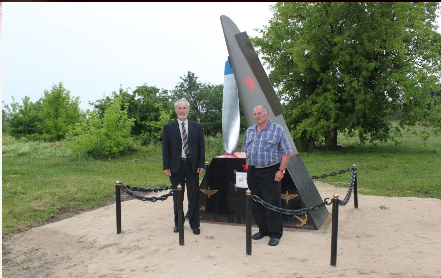
Памятник в селе Жабчицы Республики Белоруссия